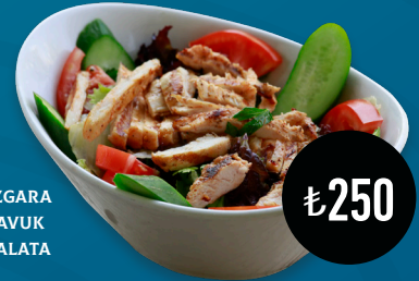
IZGARA TAVUK SALATA